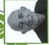
YVES VILLANE, Président de la Communauté d'Agglomération de l'Erampois Sud-Essonne

« C'était de l'inédit » affirme Yves Villane. Le forum a accueilli plus de 300 visiteurs invités à s'exprimer et donner leurs avis sur l'eau, l'agriculture, l'énergie et les déchets, thématiques des 4 tables rondes proposées dans la journée, animées par des spécialistes et partenaires locaux. « C'était très complet ! J'y avait aussi des maquettes, des ateliers scientifiques pour les enfants, des défis, un spectacle, des sketchs, sans oublier la présence de notre ambassadeur du tri et encore... je ne suis pas épuisé ! » raconte le Vice-président avant de poursuivre « L'idée était de proposer une approche à la fois ludique et sérieuse pour permettre à tous de