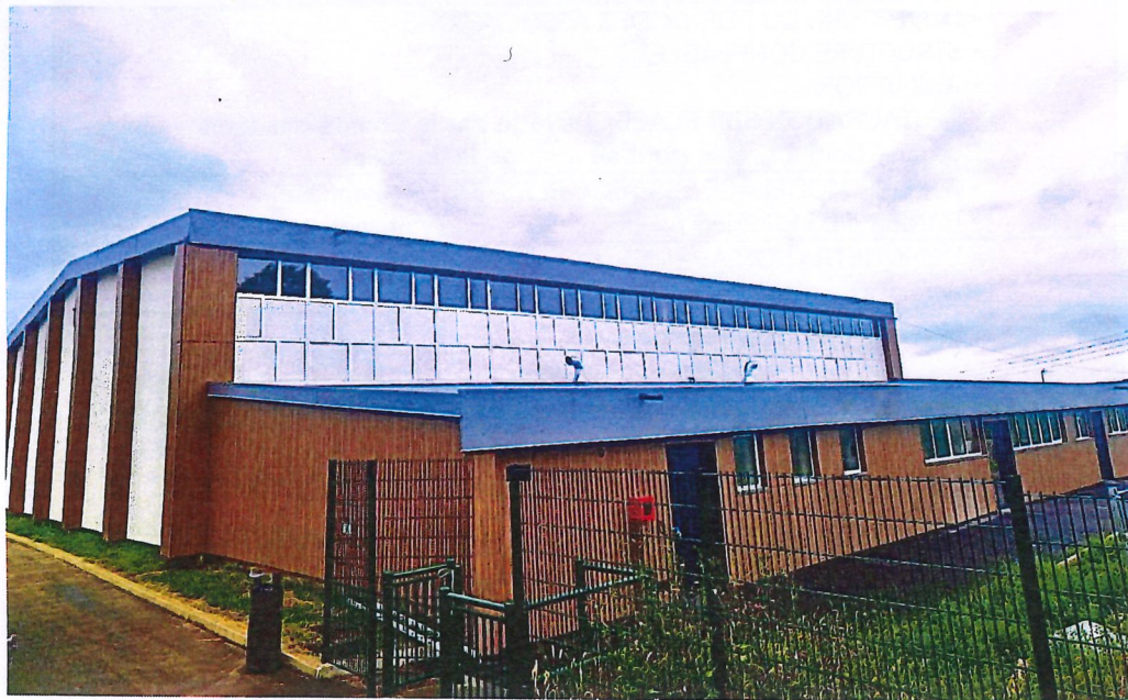
Gymnase de Bel Air – Rue de Bel Air 91660 Le Mérévillois

Mairie du Mérévillois Place de l'hôtel de ville 91660 Le Mérévillois