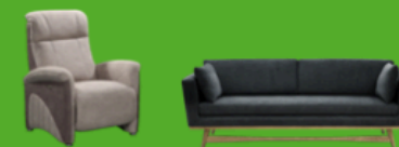
SIÈGES ET REMBOURRÉS